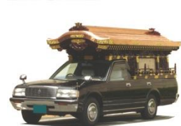
霊柩車・マイクロバス