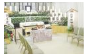
返礼品 100セット 布張りお棺 寝台車 霊柩車・マイクロバス 式場費・火葬料