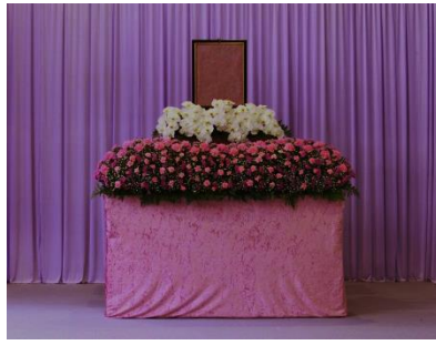
花祭壇 Aタイプの場合 設営できません