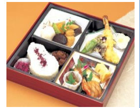
通夜料理 100名様対応分 寿司・揚げ物・煮物・香の物 ※握り寿司のプランもあります 告別式お膳 25名