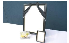
骨壺 自宅用仏具 ご遺骨用祭壇 消耗品類 カラー遺影写真