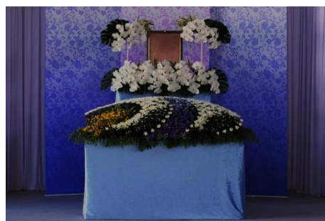
花祭壇 Bタイプの場合