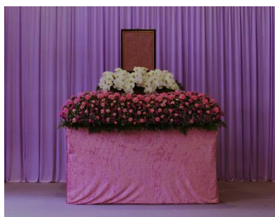
花祭壇 Aタイプの場合