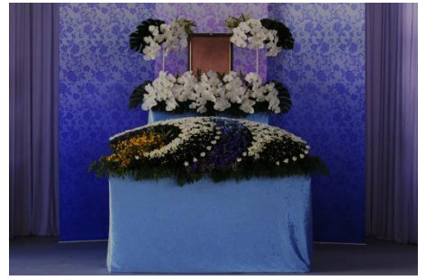
花祭壇 Bタイプの場合 設営できません

各祭壇に下記項目が共通して含まれます。人数の超過が無ければ追加料金はありません。